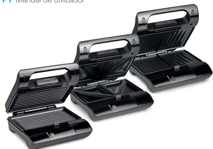
Grill Compact/Sandwich Grill Compact

01.117000.01.001/01.127000.01.001/01.128000.01.001